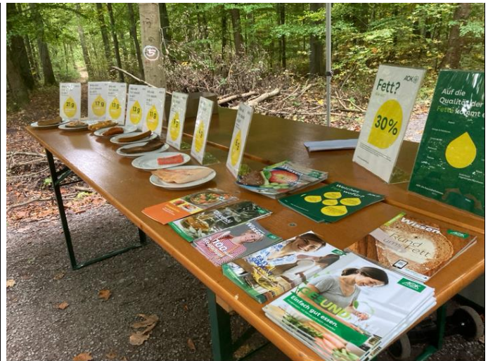
Konstruktiver Austausch im Dornet zur Arbeitssicherheit in der Waldarbeit (Bild 1, Jörn Hartmann), die auch durch bewusste und gesunde Ernährung verbessert werden kann (Bild 2, Jörn Hartmann)