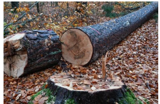
Wird künftig ab dem Fällort nachverfolgbar sein: Rohholz aus dem Landkreis Heilbronn

Die zu Deutsch „ Verordnung für entwaldungsfreie Produkte “ genannte EU-Verordnung tritt nach aktuellem Stand am 30. Dezember 2025 in Kraft. Das bedeutet, jegliches Holz das in den Markt gelangt muss in einem EU-System registriert werden und darin die Geolokalisierung sowie die Holzmenge gemeldet werden. Mit diesem Vorgang wird eine Referenz- und Prüfnummer erzeugt, die an nachfolgende Marktteilnehmer, also die gesamte, sogenannte Chain of Custody bis zum Endkunden weitergegeben. Diese Abwicklung und auch die nötige Anforderung der Sorgfaltserklärung zur Einhaltung der Verordnung wird bedarfsgerecht durch die Holzverkaufsstelle am Landratsamt erfolgen.