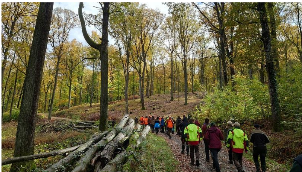
Die Studierenden der Hochschule für Forstwirtschaft auf dem Weg zum Exkursionspunkt in Güglingen-Eibensbach