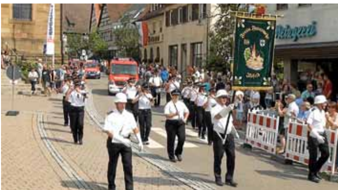
Fahnen-träger und Spielmannszug

Bei sommerlichen Temperaturen und wolkenfreiem Himmel schlängelte sich der Tross durch die vollen Straßen von Oedheim.