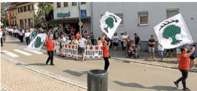
Fahnen-schwinger „Träas“ mit dem Ilsfelder Wappen

Am Sonntag, 24. Juli 2016 nahmen wir gemeinsam mit den Fahnen-schwingern „Träas“ aus Sulzbach und den Fahnen-trägern der Feuerwehr Ilsfeld am großen Festumzug der Freiwilligen Feuerwehr Oedheim teil.