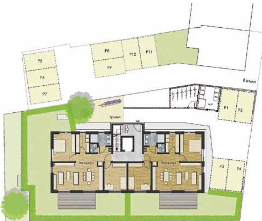
Grundriss der EG-Wohnungen

Die Gemeinde Ilsfeld hat in unmittelbarer Nachbarschaft zum neuen Ärztehaus in der König-Wilhelm-Straße ein Wohnhaus mit sechs Wohneinheiten errichtet. Mit Ausnahme des Treppenhauses aus Stahlbeton wurde das Gebäude komplett in Holzrahmenbauweise erstellt und außen mit einer vertikalen Holzfassade (Lärche) versehen. Die Innenwände werden größtenteils ebenfalls in Holzrahmenbauweise erstellt. Laut bauphysikalischem Gutachten wird der Energiestandard „KfW 55“ erreicht.