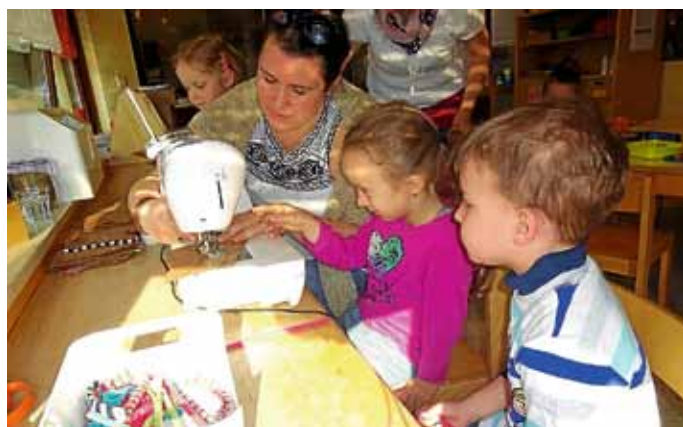
Die Sonnenkinder und Erzieherinnen