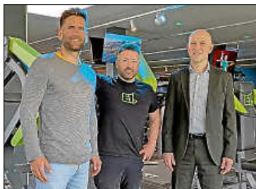
Kooperation zwischen HCG und Elaine One

Das Herzog-Christoph-Gymnasium Beilstein freut sich, eine neue Bildungspartnerschaft mit dem Fitnessstudio „Elaine One“ in Ilsfeld bekanntzugeben. Ziel dieser Zusammenarbeit ist die langfristige Förderung eines gesunden Lebensstils innerhalb der gesamten Schulgemeinschaft — dabei sind