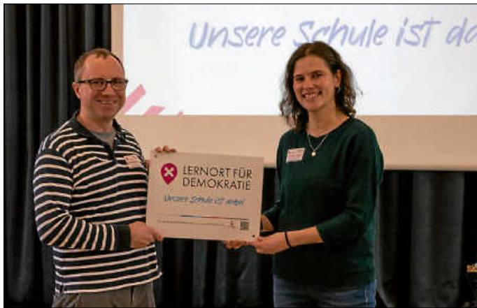
Plakettenübergabe Lernort für Demokratie

Beim Treffen am Georgii-Gymnasium Esslingen standen Fragen zur Stärkung von Schüler*innen im Umgang mit Hass im Netz, zur Förderung von Meinungsfreiheit und Meinungsaustausch sowie zum Erkennen von Desinformation im Mittelpunkt. Zudem bot das Treffen Raum für Austausch, Best-Practice-Beispiele und Vernetzung. Die Schulgemeinschaft des HCG freut sich über die Aufnahme ins Netzwerk und auf weitere Impulse durch den Austausch mit den anderen Schulen.