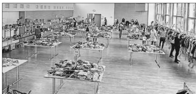
Die Halle ist bereit für den Verkaufsstart

Nachdem das Einsortieren aller Waren der 117 Verkäufer erfolgt war, traten Kassen-Teams und Verkaufsaufsichten und Türsteher ihre Schicht an. Denn leider musste die Erfahrung der vergangenen Jahre zeigen, dass immer wieder Waren durch Diebstähle abhanden kommen, wogegen durch Taschenkontrollen an Einlass und Kasse sowie Aufsichten im Verkaufsraum bestmöglich gegengesteuert wird.