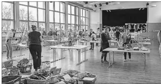
Die Waren von 117 Verkäufern werden einsortiert

Nach und nach kamen dann die Verkäufer mit ihren in Wäschekörben sortierten Waren und gaben diese beim „Check-in“ ab. Bereits im Vorfeld erfolgte die Vergabe der Verkaufsnummern online, die Waren wurden von den Verkäufern digital erfasst und diese mit entsprechenden Verkaufsetiketten versehen. Mit geübtem Blick wurden die Körbe mit Kleidung, Spielzeugen und Ausstattung, aber auch Großteile auf Anzahl und Qualität geprüft. Ungeeignete, verschmutzte oder nicht saisongerechte Ware wurde aussortiert. Alle für gut befundene Ware wurde von einem großen Team aus „Einsortierern“ anschließend auf die entsprechend beschrifteten Tische sortiert und für den Verkauf drapiert.