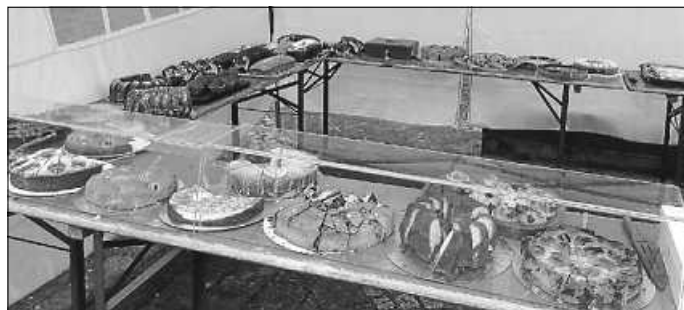
Gut bestücktes Kuchenbüfett

Gleichzeitig wurden die gespendeten Kuchen entgegengenommen und im Pavillon im Außenbereich hinter der Verkaufstheke angerichtet.