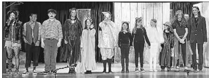
Applaus für die Schauspielklasse von Bernd Lindauer

Wir möchten Sie darauf hinweisen, dass die Bezahlung der Karten nur bar erfolgen kann.