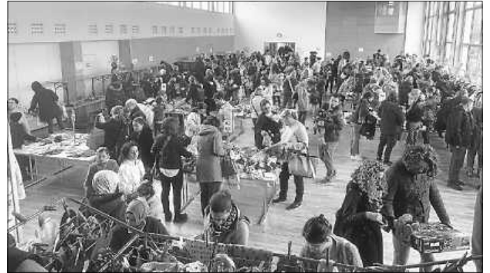
Der Verkauf ist in vollem Gange

Als Dank für ihren Einsatz startete ab 11.30 Uhr der Helfer-Verkauf – hier durften alle Helfer des Basars schon vor dem eigentlichen Verkaufsstart zugreifen und Waren vorab einkaufen. Eine halbe Stunde später startete der Schwangeren-Einlass, und um 12.30 Uhr wurden schließlich die Türen für alle Einkäufer geöffnet. In den insgesamt 3 Stunden Verkaufszeit gingen bei diesem Basar insgesamt mehr als 3.200 Artikel über die Kassentische.