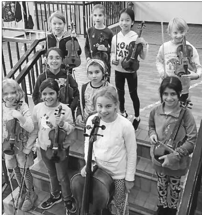
Das Kinderorchester übt für das Weihnachtskonzert

Am 8. Dezember findet unser Weihnachtskonzert statt. Streicher, Bläser, Gesang, Klavier werden solistisch und in Ensembles die Stephanuskirche Abstatt zum Klingen bringen.