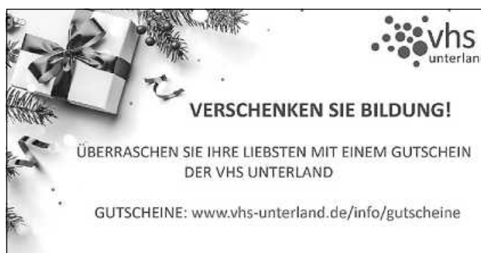
Grafik: Ilse Bolg Vhs Unterland

Das neue Programm für Frühjahr/Sommer 2023 ist ab ca. 22.12. online!