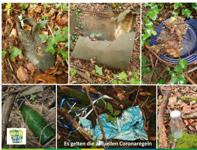
Es gelten die aktuellen Coronaregeln