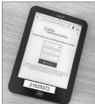
Einer von 2 ausleihbaren eBook-Readern, Modell Tolino

Wir verleihen nun auch eBook-Reader. Diese sind 4 Wochen ausleihbar. Auf die eBook-Reader lassen sich die eBooks der Onleihe, der Ausleihe elektronischer Bücher im Verbund Heilbronn-Franken herunterladen. Probieren Sie es doch einfach mal aus. Gerne stehen wir für Fragen zur Verfügung.