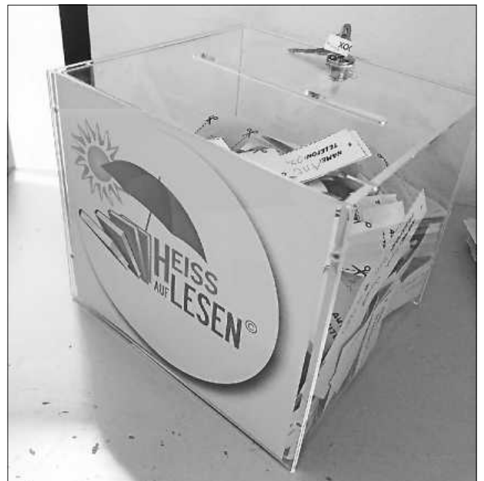
Auch für das nächste Sommerferienlesen: die neue Losbox