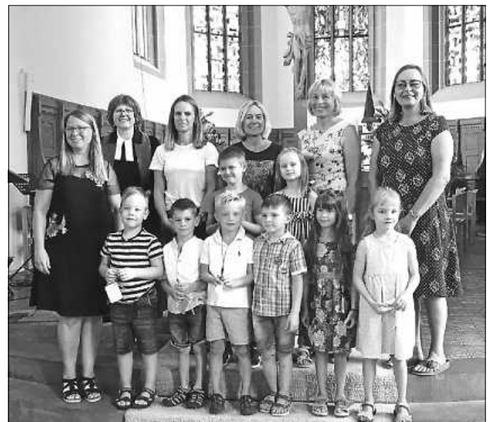
Unter diesem Motto feierten wir am vergangenen Donnerstag den Segnungsgottesdienst mit unseren Dinos aus dem Dorastift.