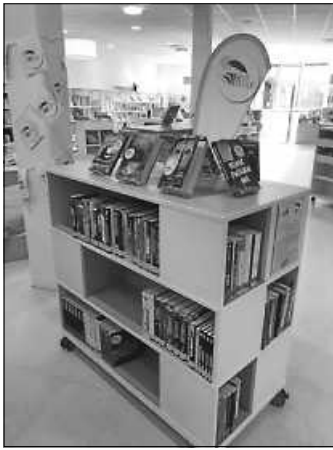
Das Heiß-auf-Lesen-Regal