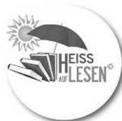
Logo: Regierungspräsidium Stuttgart

Heiß auf Lesen, die Sommerferien-Leseaktion im Regierungsbezirk Stuttgart, läuft seit dem 20. Juli. Falls ihr noch nicht angemeldet seid – kein Problem, ein Zustieg ist jederzeit möglich. Alle Schülerinnen und Schüler der Ilsfelder Grundschulen und der weiterführenden Schulen bis Klasse 9 können mitmachen. Anmeldeflyer gibt es in der Mediothek. Ihr könnt euch auch digital anmelden, das Anmeldefomular findet ihr auf der Startseite unserer Homepage www.ilsfeld.de/mediothek .