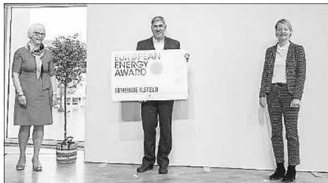
v. l. n. r.: Frau Heute-Bluhm (Präsidentin des europäischen Trägervereins Association European Energy Award AISBL), Herr Reiner Vogel (Stellvertretender Bürgermeister Gemeinde Ilsfeld), Frau Thekla Walker (Ministerin für Umwelt, Klima und Energiewirtschaft)

nung dieser Stufe erhalten. „Über ein Drittel der Städte, Gemeinden und Landkreise, die deutschlandweit am European Energy Award teilnehmen, stammen aus Baden-Württemberg. Dieser Spitzenplatz zeigt das große Engagement der Kommunen im Land, CO 2 -Emissionen zu reduzieren, erneuerbare Energien auszubauen oder Gebäude effizient zu sanieren“, sagte Landesumweltministerin Thekla Walker bei der Preisverleihung in Ulm. „Die Auszeichnung mache die Leistungen der Kommunen für mehr Klimaschutz im Land sichtbar. Insgesamt 26 Kommunen erhielten dieses Jahr den European Energy Award.“