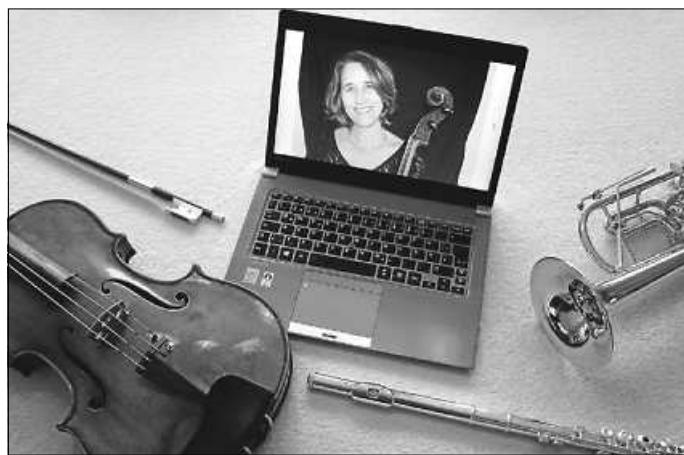
unser digitalmusikalischer Austausch

Und die Tutorials kann man mehrmals nutzen. Auch die musikalische Früherziehung produziert kleine Videos.