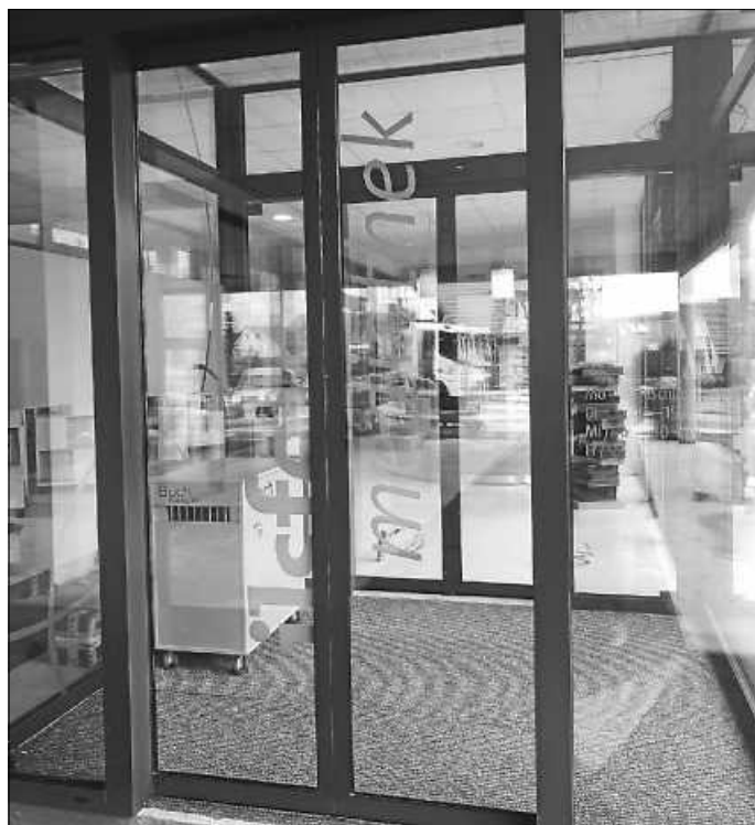
Der Abholservice läuft über den Windfang.

Wir kontaktieren Sie dann und nennen Ihnen einen Abholtermin .