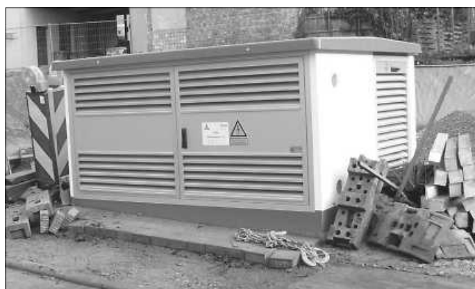
Trafostation in der Brückenstraße

Die Trafostation in der Brückenstraße wird um wenige Meter in Richtung Norden verlegt werden, eine solche spätere Verlegung in Abhängigkeit der Fundamentpläne für die Parkgarage wurde bereits bei der Aufstellung berücksichtigt. Die dafür entstehenden Kosten werden von der Syna getragen. Vor diesem Hintergrund wird zeitweise der Gehweg in Anspruch genommen werden müssen. Eine Umleitung für Fußgänger ist gegeben. – Wir bitten dies zu berücksichtigen.