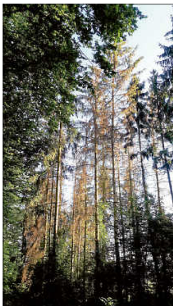
Borkenkäferbefall an Fichte