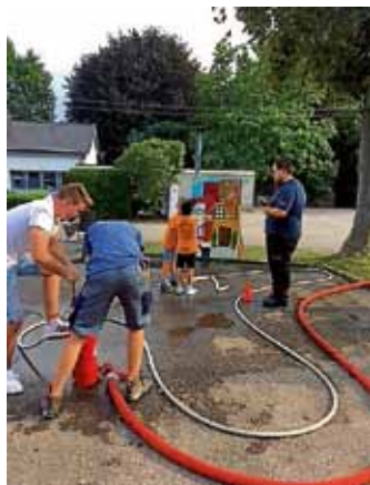
Teamarbeit war angesagt - Wasser marsch