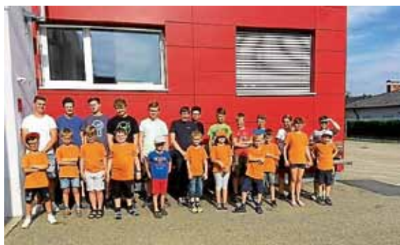
Kinder- und Jugendfeuerwehr bei der gemeinsamen Übung