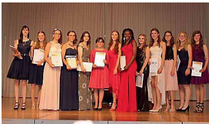
Mit Freude und voller Stolz zeigten sich die diesjährigen Preisträgerinnen