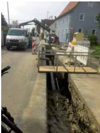
Verlegen von Nahwärmeleitungen in Ilsfeld