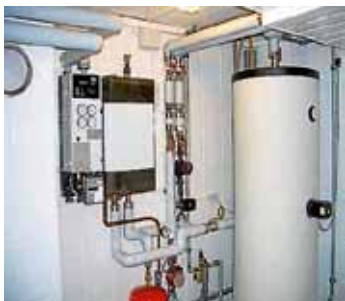
Beispiel einer Übergabestation

Ende 2018 läuft die mehrfach erwähnte Förderung der EU aus, danach wird der kostenfreie Anschluss an das Nahwärmenetz nicht mehr möglich sein. Dieses gilt für alle Ortsteile (Auenstein, Ilsfeld, Helfenberg) gleichermaßen. Nur aufgrund der umfangreichen Förderung durch die EU und das Land Baden-Württemberg war es in den vergangenen Jahren möglich, den Hausanschluss inklusive Übergabestation in den Haushalten unentgeltlich zur Verfügung zu stellen, die einen „Vollanschluss mit Wärmelieferungsvertrag“ beantragt hatten.