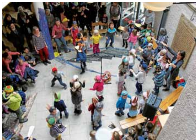
Beim Osterhasenrap hält es niemand mehr auf den Beinen.

Am Ende wünschten alle Villa-Kinder den Zuschauern eine frohe Frühlings- und Osterzeit. Im Rahmen des Projekts „Schulreifes Kind“ hatten die Großen süße Keks-Häschen gebacken und verteilt diese zum Abschluss noch an die anderen Kindergärten, die zum Zuschauer gekommen waren und an das restliche Publikum.