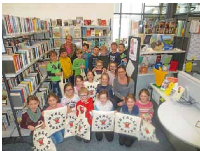
Klasse 2 c