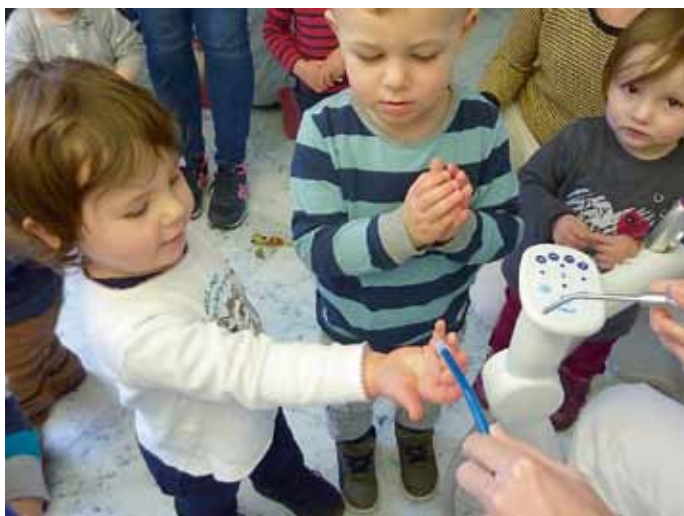
Es grüßen die Zwerge der Zwergenstube