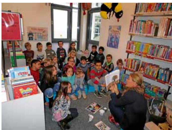
Klasse 2 b