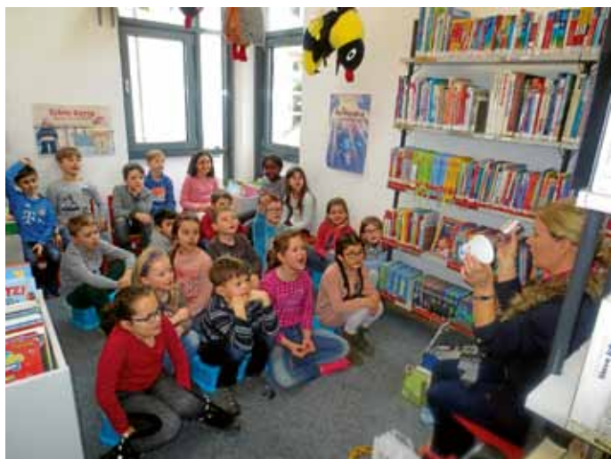
Klasse 2 a