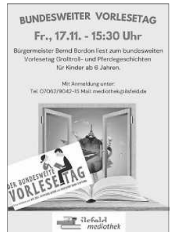
Plakat: Mediothek Ilsfeld

Mit Anmeldung persönlich, telefonisch oder per E-Mail