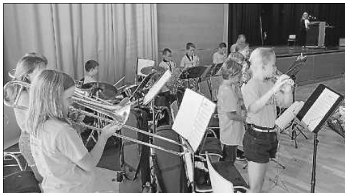
Einschulung in Untergruppenbach