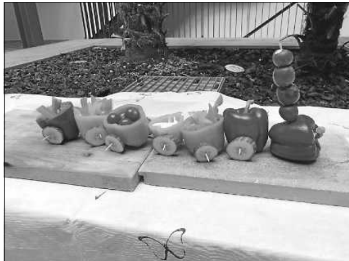
Der Zug war gefüllt mit knackigem Gemüse.

der grünen Leseinsel statt und am Ende durften die Kinder ihre Kuscheltiere in der Lesehöhle zu Bett bringen. Doch nachdem die Kinder von ihren Eltern abgeholt wurden, wachten die Kuscheltiere wieder auf und erlebten in der Nacht und am nächsten Morgen noch allerlei in der Mediothek. Was das war, konnte man auf dem Instagram-Kanal der Mediothek mediothek.ilsfeld miterleben. Folgen Sie uns doch gerne auf diesem Kanal für Einblicke der etwas anderen Art in die Mediothek - auch die Kuscheltierbeiträge können noch nachgelesen werden.