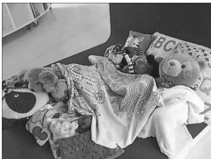
Am Ende schliefen alle Kuscheltiere in der Lesehöhle.

Das Sommerferienprogramm der Mediothek, die Kuscheltier-übernachtung, war ein Angebot für Kinder zwischen 5 und 7 Jahren, das vom Mediotheksteam liebevoll gestaltet wurde. Zu Beginn der Veranstaltung durften die Kinder das mitgebrachte Kuscheltier kurz mit Namen und Besonderheiten vorstellen.