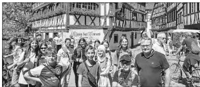
Text/Fotos: Darius Germann