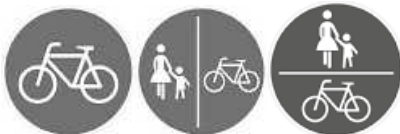
Zeichen 237, 240, 241 StVO Gemeinsamer Geh- und Radweg

Fahrräder sind Fahrzeuge im Sinne der Straßenverkehrsordnung. Damit ist grundsätzlich die Fahrbahn zu benutzen, es sei denn, es existiert ein Radweg, der mit Verkehrszeichen 237, 240 oder 241 beschildert ist.