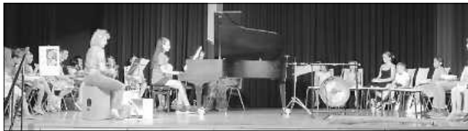
Bei den Klaviermäusen