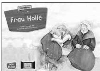
Grafik: Don Bosco

Neu im Jahr 2023 ist, dass es aufgrund der großen Nachfrage künftig zwei Vorlesetermine geben wird, nämlich um 16:30 Uhr und gleich im Anschluss um 17 Uhr und dass der Lesezirkus künftig regelmäßig auch für Kleinere angeboten wird!