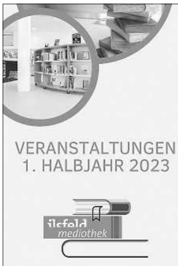
Grafik: Mediothek Ilsfeld

Entdecken Sie das neue Veranstaltungsprogramm für das 1. Halbjahr 2023 – erhältlich in der Mediothek oder online auf unserer Homepage www.ilsfeld.de/mediothek unter „Treffpunkt“.