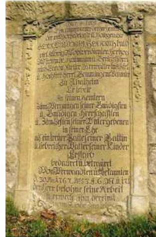
Grabplatte von Ludwig Heinrich Kalb

Dabei spannt sich der Bogen von den Grabsteinen angesehener Bürgerinnen und Bürgern bis zu den Grabsteinen der Ilsfelder Bürgermeister, die ab dem Jahr 1850 die Entwicklung des Dorfes gestalteten.