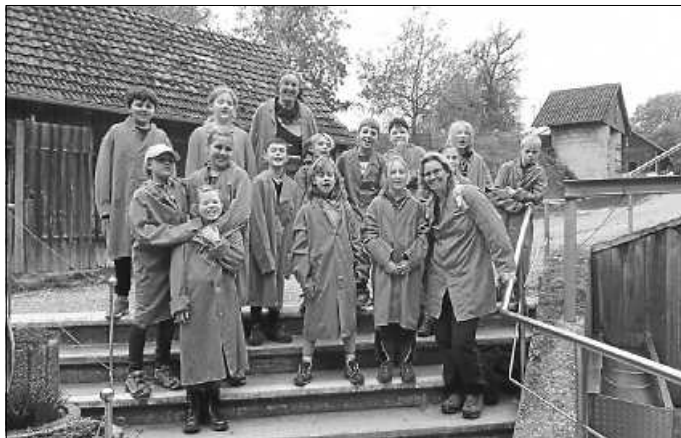
Bereit für den Stall

Am Anfang von der Schweineschule waren wir im Stall. Es gab drei Aufgaben: Reporter, kochen und Schweinestall ausmisten.