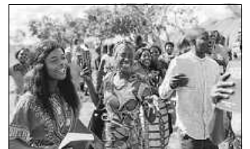
Freude über die erste eigene Bibel

Ab dem 1. Advent bis zum 2. Weihnachtsfeiertag werden nach dem Gottesdienst ‚BibelSterne‘ gegen eine Spende von 7 Euro angeboten. Jeder so erworbene Bibelstern bringt eine komplette Bibel inklusive Schulungsmaterial auf den Weg nach Sambia. Überweisungen sind ebenfalls möglich: Volksbank Beilstein-Ilsfeld, IBAN DE28 6206 2215 0050 1380 06, Stichwort „Aktion Bibelstern“. Was gibt es Passenderes als zu Weihnachten Gottes Wort zu verschenken? (Quelle: Bibel Liga)