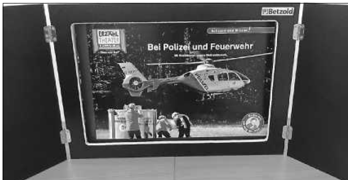
Wir schauen uns Polizei und Feuerwehr genauer an

Vorlesestunde für Kinder ab 4 Jahren. Dauer 30 Minuten. Die Teilnehmerzahl ist begrenzt. Eine Anmeldung in der Mediothek ist erforderlich.