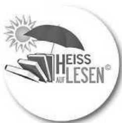
Logo: Regierungspräsidium Stuttgart

Bitte sagt uns – ebenfalls bis Mittwoch, 15.09. – Bescheid, ob ihr mit dabei seid, so dass wir gut planen können. Bei der Abschlussparty ziehen wir die Heiß-auf-Lesen-Gewinnerinnen und -Gewinner aus dem Losglas, das ihr gefüllt habt. Seid gespannt auf unsere schönen Preise, die an diesem Nachmittag an euch fleißige Leserinnen und Leser verlost werden. Alle Heiß-auf-Lesen-Clubmitglieder erhalten auch eine Urkunde für die Teilnahme. Außerdem dürft ihr euch auf den Zauberkünstler Dennis freuen.