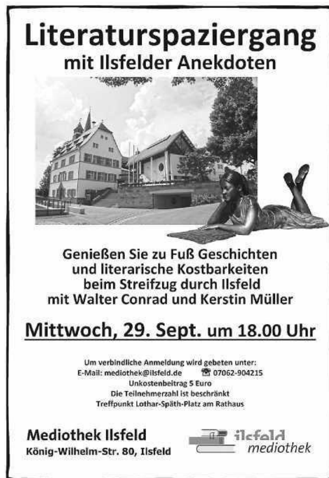
Plakat: M. Kloiber

Anmeldung in der Mediothek per E-Mail, Telefon oder persönlich. Unkostenbeitrag 5 €. Bitte beachten Sie, dass laut geltender Corona-Verordnung nur Personen teilnehmen können, die am Veranstaltungstag den Impf- oder Genesenennachweis bzw. einen tagesaktuellen Negativtest vorlegen können.