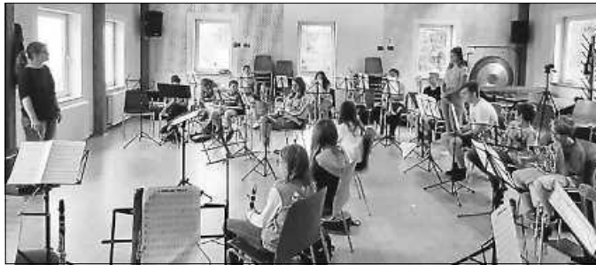
Bei der Probe

hängigkeit beider Hände. Um 10 Uhr trafen dann Schüler aus verschiedenen Schozachtal-Orchestern ein und bildeten ein „Ferienorchester“, das mit dem Kursteilnehmer/innen das Proben und Dirigieren übte. Die Schüler lernten gleichzeitig, mehr auf die Dirigierenden zu achten. So konnten letztendlich alle aus den vier Tagen etwas mitnehmen.