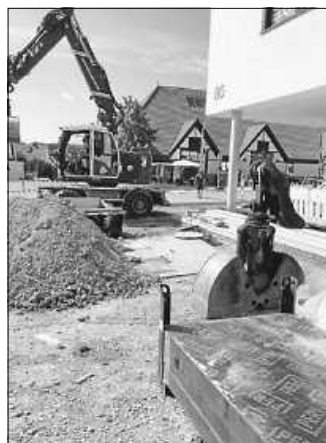
Bagger, Baugeräte, Lastwagen

Lassen Sie sich überraschen – wir packen ausgewählte Titel in Zeitungspapier und Packschnur ein und geben Ihnen einen kleinen Hinweis zum Inhalt des Buches. Wenn Sie das Buch gelesen haben, so freuen wir uns, wenn Sie die Bewertungskarte ausfüllen, die dem Buch beiliegt. Dies ist aber natürlich kein Muss. Seien Sie offen für unsere Auswahl, wer weiß, welche Perlen sich unter der Verpackung verbergen.