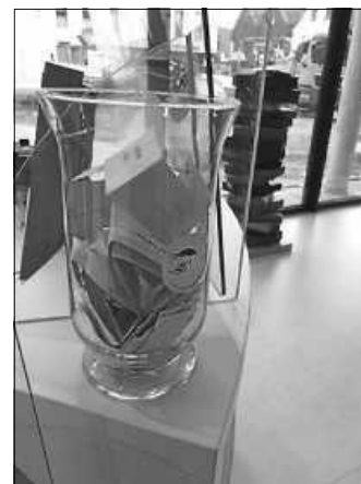
Das Losglas für die Heiß-auf-Lesen-Lose wird immer voller.