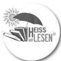
Logo: Regierungspräsidium Stuttgart

Heiß auf Lesen, die Sommerferien-Leseaktion im Regierungsbezirk Stuttgart, ist erfolgreich gestartet und es sind bereits etliche Lose für viele gelesene Bücher in unserem Losglas. Wenn ihr noch mitmachen wollt – kein Problem, ein Zustieg ist jederzeit möglich. Alle Schülerinnen und Schüler der Ilfeldener Grundschulen und der weiterführenden Schulen bis Klasse 9 können teilnehmen. Anmeldeflyer gibt es in der Mediothek. Ihr könnt euch auch digital anmelden, das Anmeldeformular findet ihr auf der Startseite unserer Homepage www.ilsfeld.de/mediothek .