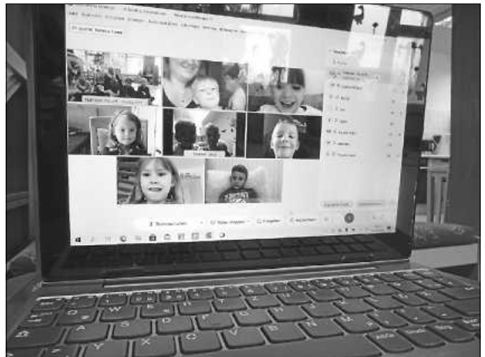
Die Kinder zu Hause am Bildschirm