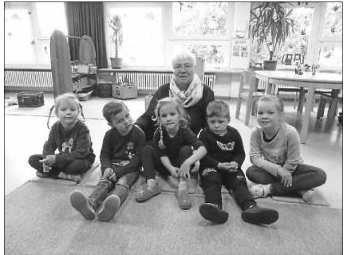
Die Kinder im Kindergarten

Wir haben über diesen Weg festgestellt, dass wir uns alle sehr vermissen und wünschen uns nun, dass der dritte Lockdown schnell zu Ende geht!