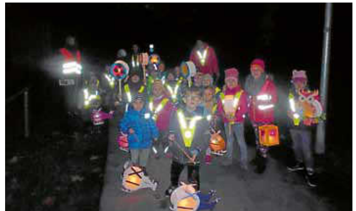
Begonnen wurde das Fest mit einer Begrüßung im Sitzkreis und einem Lied, danach wurde die Geschichte der Laterne „Lummina“ vorgelesen, die ihr Licht durch den Wind verlor und einen neuen Laternenfreund fand – der ihr wieder Licht schenkte.