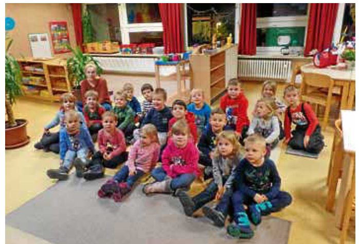
Danach gab es für alle selbstgebackene Zimtschnecken, Kekse, Lebkuchen, Kaba und Kinderpunsch zur Stärkung, bevor es nach draußen zum gemeinsamen Laternenlaufen und Singen ging. Das Wetter spielte zum Glück gerade so mit. Und so konnte der Abschluss gemeinsam mit den Eltern singend vorm Kindergarten stattfinden. Nach dem Lied „ich geh mit meiner Laterne“ gingen alle müde, aber glücklich nach Hause.