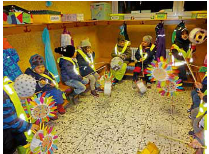
Die Kinder der Gruppe 1, 2, 3 und der Krippe trafen sich an verschiedenen Abendterminen zum Laternenfest im KiGa.

nicht nur mit Lichtern, sondern auch mit Gesang füllen konnten. Die Erzieherinnen hatten sich wirklich viel Arbeit gemacht, damit es so schön werden konnte.