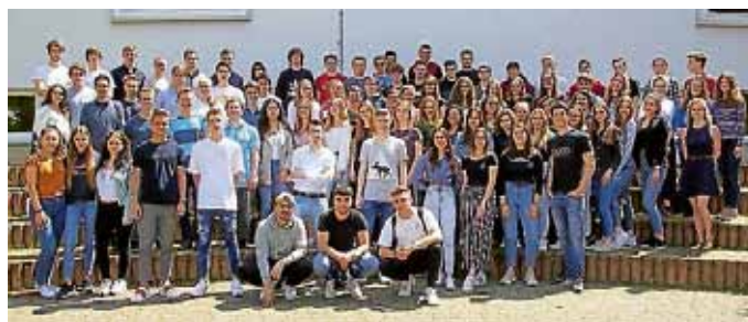
Mit Freude und Stolz erhielten die Abiturientinnen und Abiturienten ihr Abschlusszeugnis.